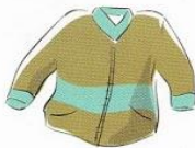
La cazadora o